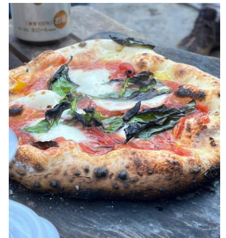
本格石窯ピザ焼き