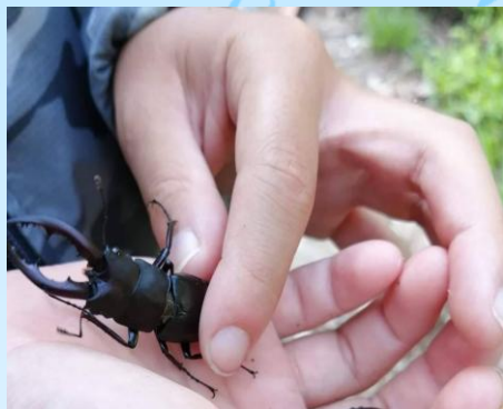
バナナトラップにて